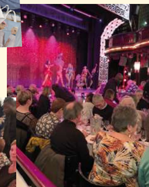
Déjeuner spectacle au Paradis Latin